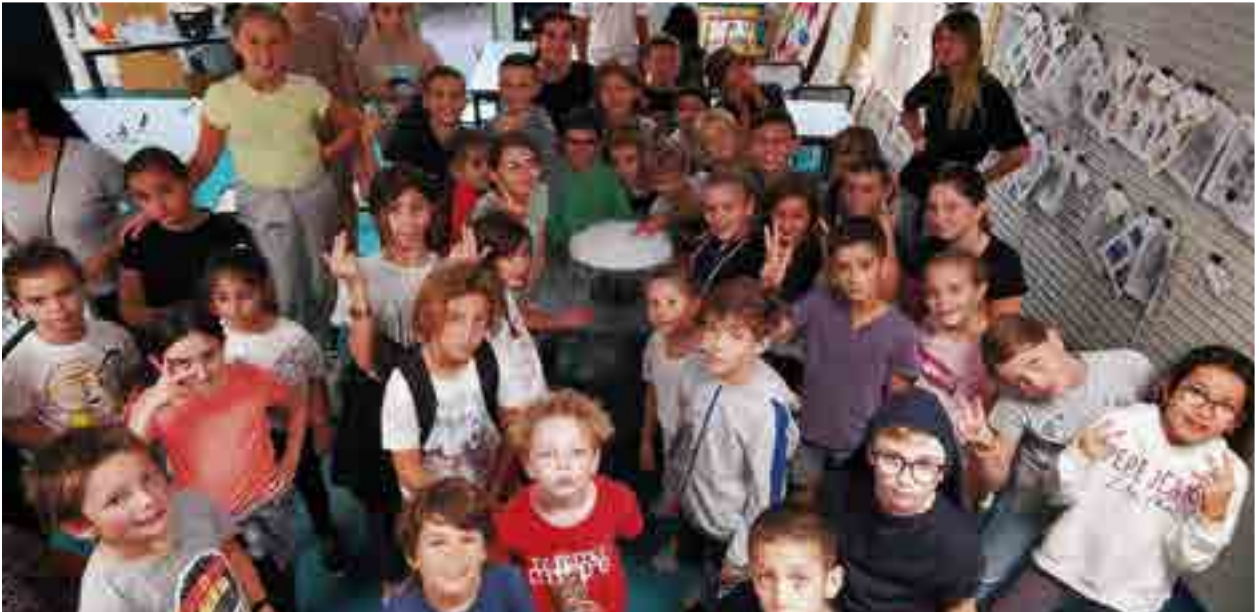
Lors des vacances de la Toussaint, les 8/12 ans ont participé à des expériences scientifiques dans le cadre des semaines Animations Sports Vacances