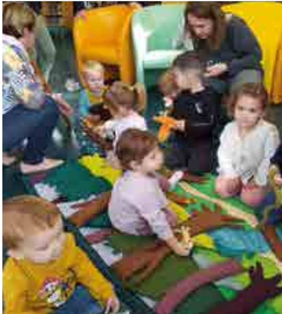
Dans le cadre de l'activité « rencontre tapis » la médiathèque a accueilli les grandes sections de maternelle Vessiot et la Culasse ainsi que les grands de la crèche.