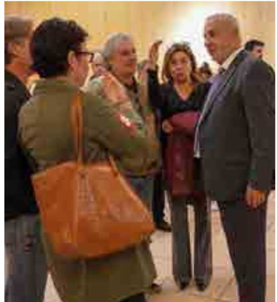
Le 09/11, M. le Maire et ses élus recevaient les nouveaux arrivants sur la commune. L'occasion de détailler les nombreux avantages auxquels ils auront désormais accès.