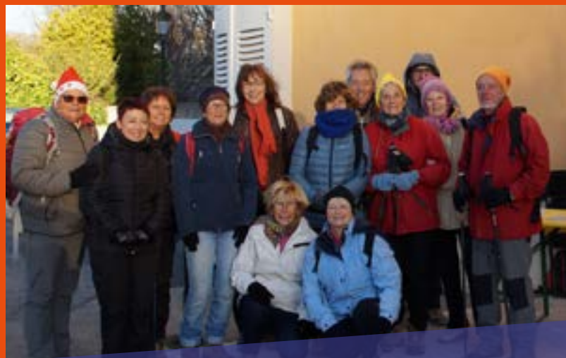
Le 9 décembre, l'Escapado de Gemo récolte 484 € pour le Téléthon à l'occasion de leur "Randonnée de l'Espoir"