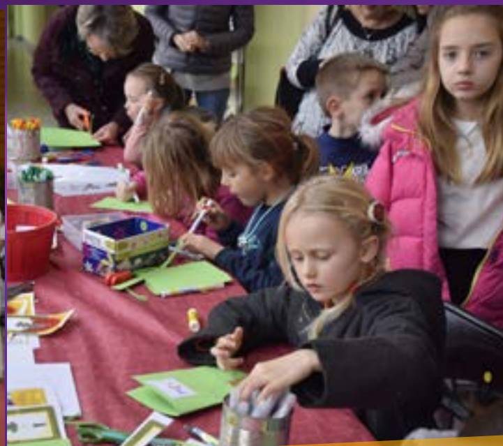
Mercredi 20 décembre, le sport, les ateliers créatifs et la musique ponctuent le Noël gourmand de l'Espace A. Giraldi