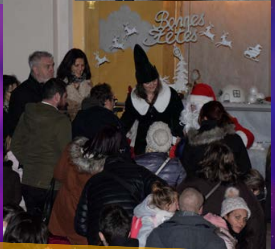
Le 16 décembre, "La Magie de Noël" opère sur le parvis de la Mairie. Stands gourmands, animations, ouverture de la patinoire, arrivée du Père Noël et illuminations agrémentent cet instant unique