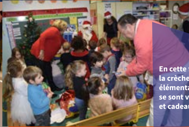
En cette fin d'année, de la crèche, aux écoles élémentaires, tous les enfants se sont vu remettre friandises et cadeaux par la Mairie.