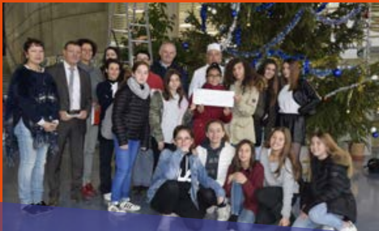
Le 18 décembre, les élèves du collège et leurs encadrants remettent un chèque de 3000 € au Téléthon, fruit de la vente de pains au chocolat