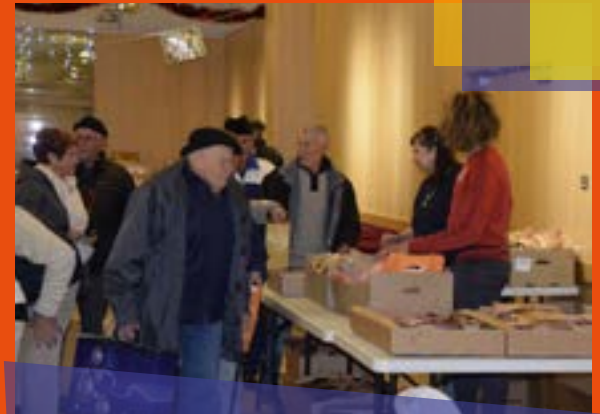
Le 11 décembre, remise des colis de Noël aux aînés