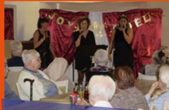
le 15 décembre, le goûter de Noël à Flore d'Arc, en musique et en chansons