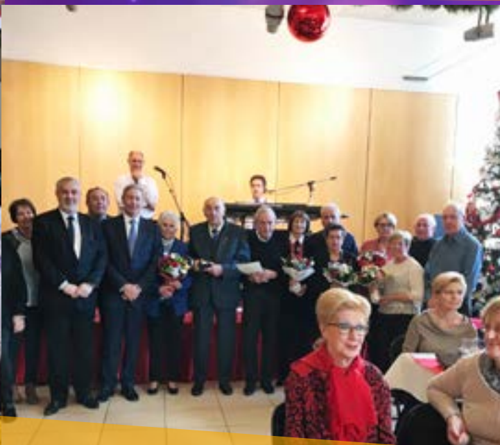
Le 21 décembre, juste avant le repas dansant offert à nos aînés, M. le Maire remet les médailles "50 ans de mariage"