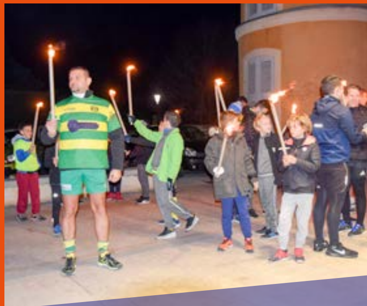
Le 8 décembre, bravant le froid, les membres et les joueurs du GREP, font la retraite aux flambeaux pour le Téléthon