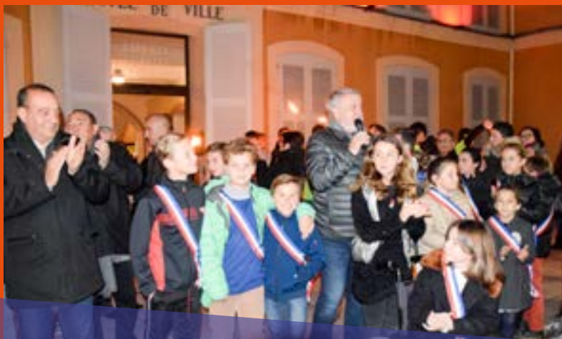
Le 8 décembre, le Conseil Municipal des Jeunes, fraîchement installé, donne le top départ du Téléthon avec M. le Maire