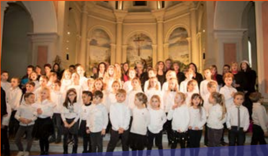
Le 3 décembre, l'école Municipale de musique présente "Les voix de Noël" en l'église St Martin